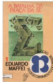
Figuras 5 – Livros sobre o confronto entre integralistas (AIB) e antifascistas (FUA) na Praça da Sé (SP). “A Revoadada das Galinhas Verdes”, Flávio ABRAMO e “A Batalha da Praça da Sé”, Eduardo MAFFEI.