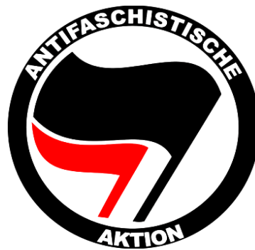
Figura 4 – Bandeira Antifa : as bandeiras sobrepostas (o vermelho, comunistas; o preto, anarquistas).

Deste modo, adeptos de táticas e ações antifascistas, em agrupamentos ou não, podem cultivar simbologias próprias que contraponha extremistas de direita, ou fascistas. Assim, além da estética violenta do dano, sobretudo a cultura capitalistas, alguns símbolos estéticos marcaram as ação antifascista. O mais icônico deles talvez seja as bandeiras sobrepostas, criada pelos revolucionários, Marx Kelson e Max Bivard (BALHORN, 2018; BRAY, 2019).