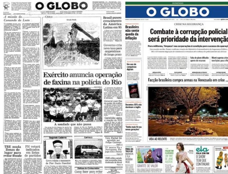
Figura 12 – Jornal O Globo de 94, noticiando Operação Rio e em 2018, noticiando Intervenção Federal.

de popularidade para as próximas eleições, seja por meio de uma melhora aparente e passageira na questão da violência urbana, ou pela impressão de que Temer não tem receio de tomar atitudes duras contra a criminalidade” (ORTEGA; MARIN, 2019, p. 167).