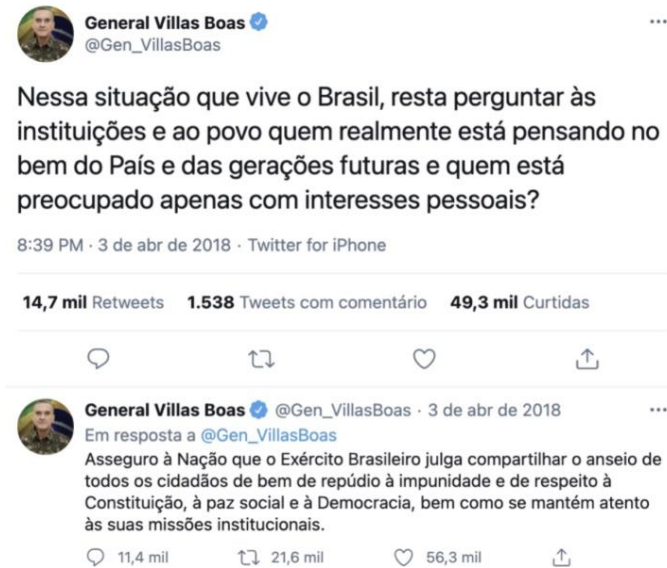
Figura 13 – Tuíte do general Villas Bôas antes do julgamento do habeas corpus a Lula pelo STF.

antes do julgamento do habeas corpus para o presidente Lula, pelo Supremo (que acabou negado, levando à prisão do então ex-presidente, naquela época candidato e líder nas pesquisas para a Presidência).