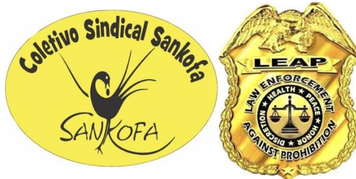
Figura 16 – Símbolo do Coletivo Sindical Sankofa e Brasão da Leap

A conexão entre os indivíduos, e as discussões abertas por esses dois grupos, e outros atores do campo da segurança espalhados pelo país, mesmo com todas as especificidades pessoais e corporativas, possibilitou que os debates e os encontros se estreitassem dali em diante. Nascia ali, “os policiais para a democracia 114 ”, o embrião do Movimento dos Policiais Antifascismo (MPAF) 115 .