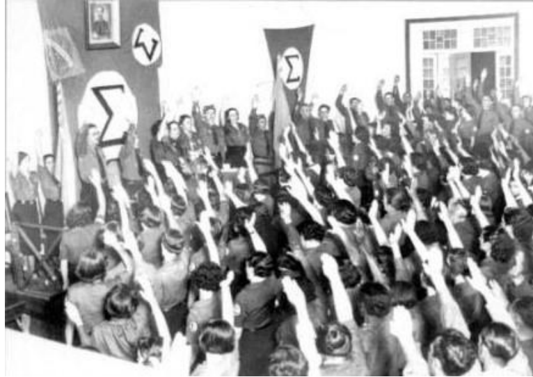
Figura 3 – Anauê! A saudação à bandeira azul (foto em p/b) com o sigma no centro.

Embora se fale em algo como “01 milhão!”, inclusive, dito pelo próprio Salgado, os números do integralismo são incertos, e os dados mais otimistas dão conta de algo entorno de 300 a 500 mil membros, o que dada a época, a estimativa populacional, sua distribuição no território brasileiro, enfim, mesmo 400 ou 500 mil já seria um expressivo contingente, o que, deste modo, torna a AIB no primeiro partido de massas do país (CAVALARI, 1999; GONÇALVES; CALDEIRA NETO, 2020).