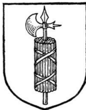
Figura 1 – Fascio : adotado como símbolo pelo movimento fascista italiano.

A palavra fascismo deriva do termo latino fascio ou fasci , e ainda com significado hoje de “feixe”, um símbolo de poder da era romana, que consistia na junção de várias varetas de madeira, vários feixes amarrados por um cordão, que sustentava uma lâmina, um machado. “Os machados simbolizavam o poder do Estado de decapitar os inimigos da ordem pública. E as varas amarradas em redor do cabo constituíam um feixe que representava a unidade do povo em torno da sua liderança” (KONDER, 2009).