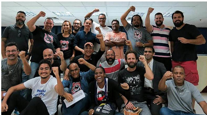
Figura 19 – Foto do 1º Seminário do MPAF, na OAB/RJ.

nas universidades, sempre houve uma troca mútua. Inclusive, o marco fundacional do próprio Movimento se deu na sede da OAB/RJ.