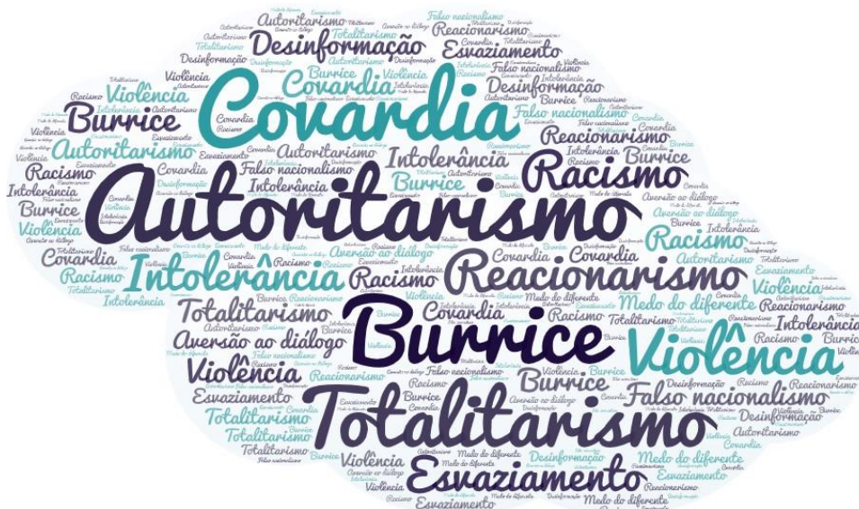
Figura 22 – Nuvem de palavras.

Quando pensa em fascismo que três palavras ou expressões lhe vêm à cabeça?