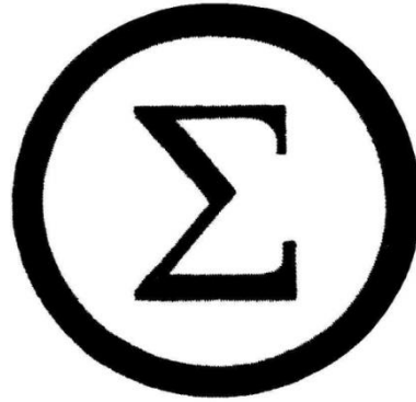
Figura 2 – Sigma : símbolo adotado pelo movimento integralista brasileiro.

Esse nacionalismo era um “retorno às raízes brasileiras”, por isso, e, em oposição ao fascismo italiano e ao nacional socialismo alemão, o fascismo brasileiro exaltava os indígenas – a saudação “ Anauê ” é uma expressão tupi –, aceitava os negros – a AIB mantinha fortes relações com a FNB (Frente Negra Brasileira), movimento de intelectuais negros –, e consagrava o homem do interior como “o verdadeiro brasileiro”. Era, portanto, imperioso a “mistura das raças”. O negro, o branco e o indígena, seria uma só raça, convergente e unificada, a “eugenia positiva” (SENTINELO, 2010).