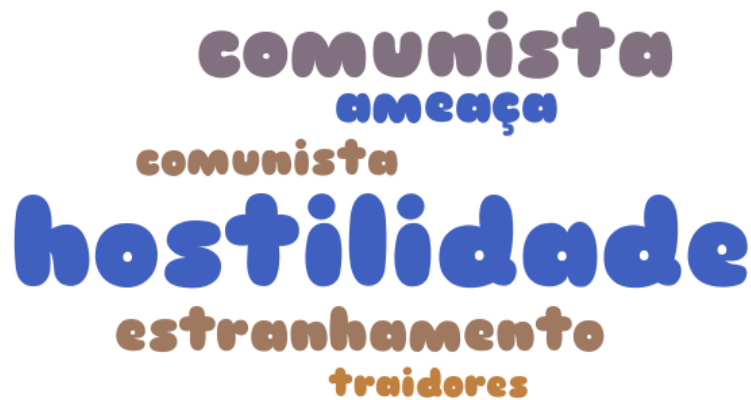
Figura 26 – Nuvem de palavras.

Como o Movimento de Policiais Antifascismo é visto instituições policiais?