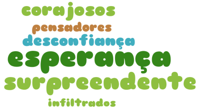
Figura 25 – Nuvem de palavras.