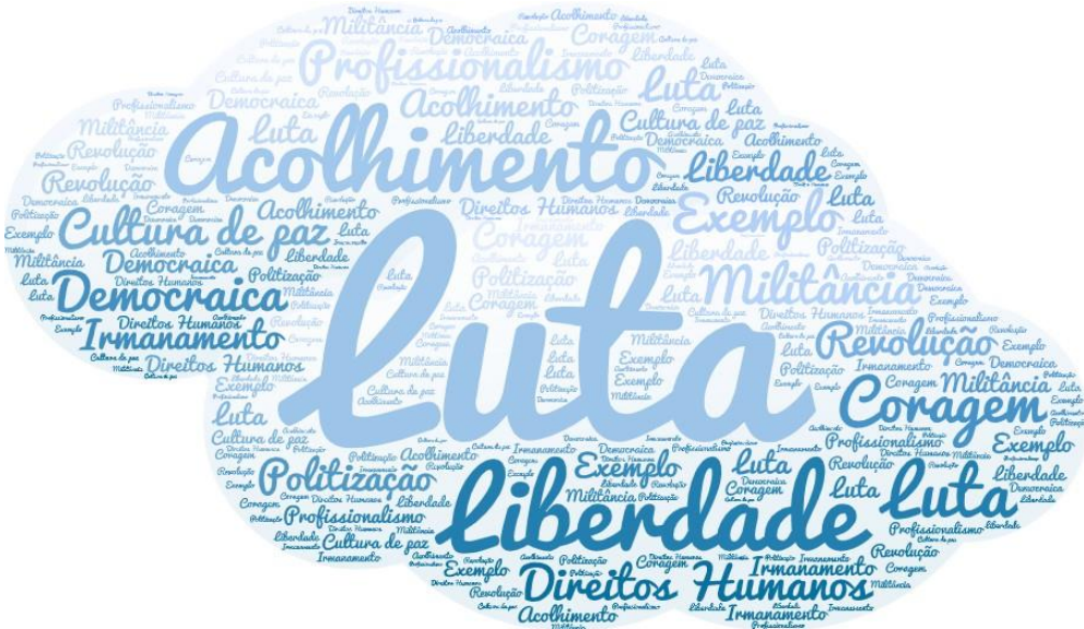
Figura 21 – Nuvem de palavras.

Quando você pensa em MPAF que três palavras ou expressões lhe vêm à cabeça?