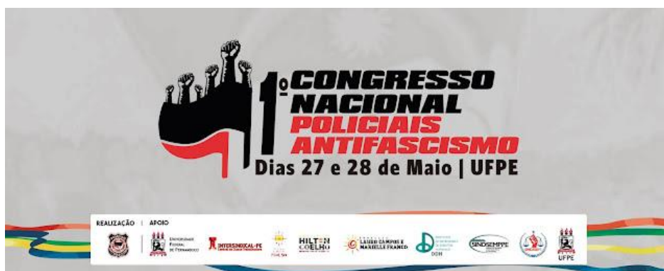
Figura 20 – Cartaz do 1º Congresso Nacional do MPAF.

“policiais se manifestem dentro das regras democráticas. Primeiro para revelar isso aos outros policiais (...). Segundo, para dizer para a sociedade não desistir do diálogo conosco. Porque estamos tentando fazer a mudança por dentro 133 ”. Aliás, esse debate é motivo de querelas internas no movimento, com integrantes defendendo uma posição mais corporativista, mais classista do movimento, e outros defendendo exatamente o inverso, um diálogo mais intenso com a sociedade.