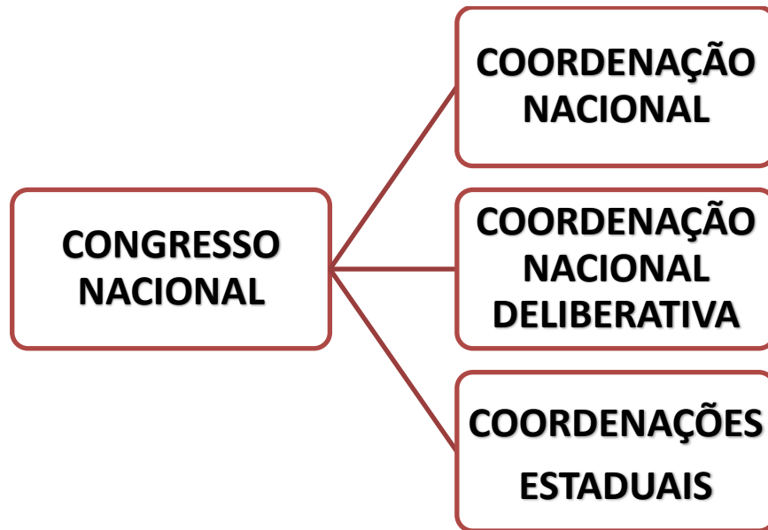
Figura 23 – Organograma MPAF. Fonte: pesquisa/entrevista com integrantes do MPAF/2022.

Já sobre como o MPAF é visto pela sociedade, por seus membros, e pelas instituições policiais, os entrevistados disseram que: para os membros, a existência do grupo é vista como “bálsamo”, um “oásis”, um “lugar de trocas de afetos e de experiências”. Para a sociedade, em geral, há uma boa receptividade, com alguns olhares de “estranhamento”, exceto aqueles que se ligam ao espectro político à direita, ou ao conservadorismo. Para esses o movimento não passa de um “bando de traidores”, “infiltrados”. No geral, é a mesma receptividade no meio policial. Além das alcunhas pejorativas de: “comunistas”, “esquerdistas”, “revoltados”, e etc.