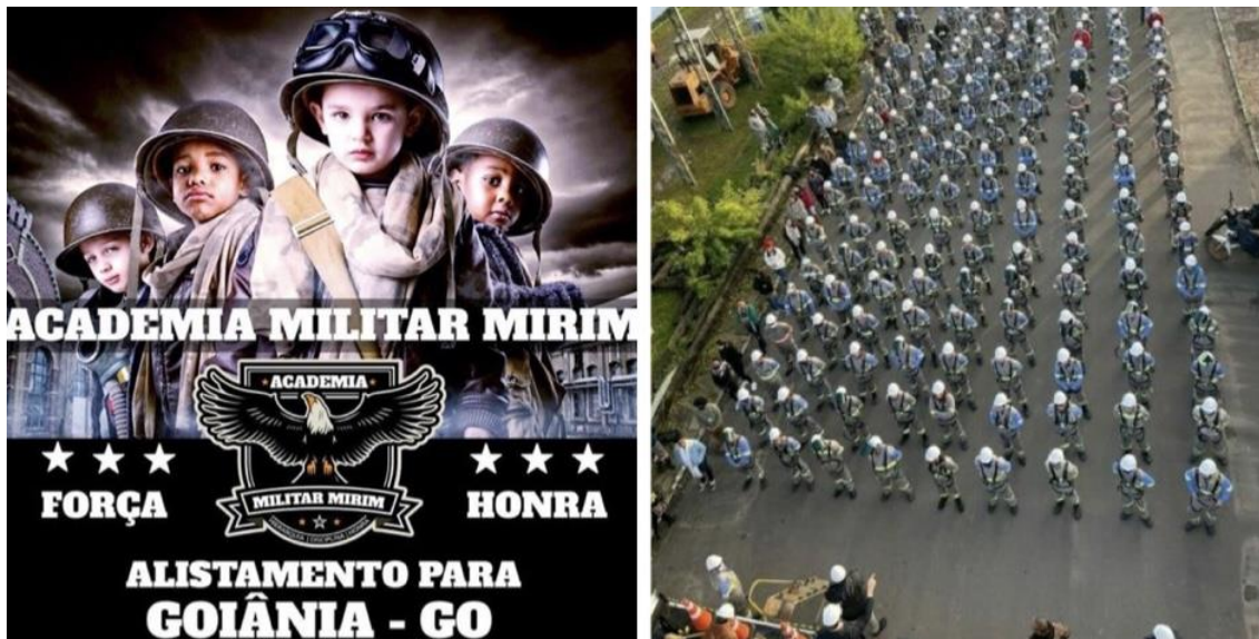
Figura 10 – Cartaz da Academia Militar Mirim e de funcionários de empresa de energia perfilados.

funcionários do banco estatal para fazer flexões de braço 54 . Pessoas comuns, trabalhadores emulando no seu cotidiano de trabalho um ritual eminentemente militar.