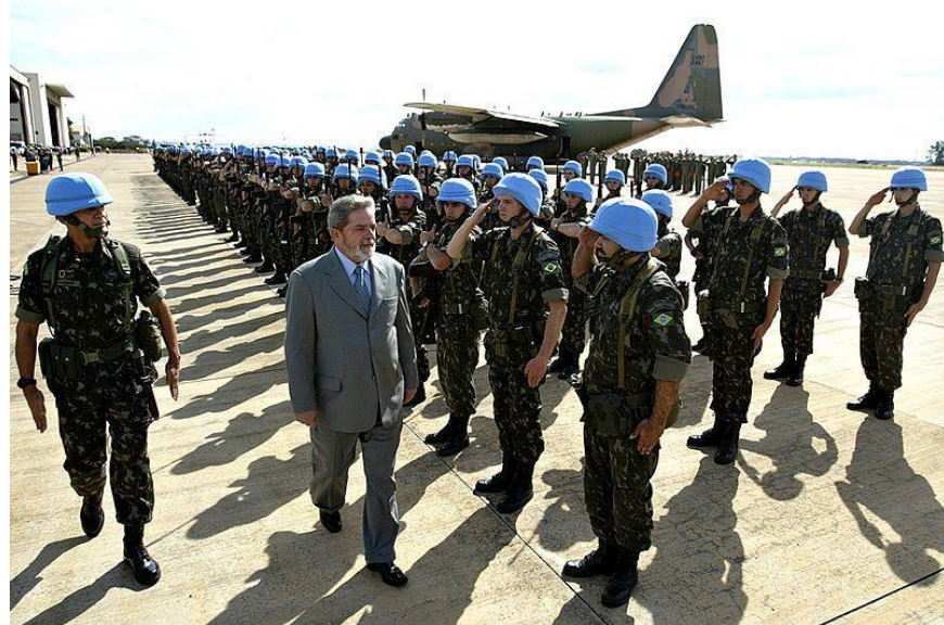
Figura 11 – o então presidente Lula em revista as tropas que atuavam na Minustah.

Portanto, sob a batuta dos “governos progressista” do Partido dos Trabalhadores (PT), o acionamento das FA em contexto de segurança pública foi uma constante. Dá garantia das obras do PAC (Programa de Aceleração do Crescimento) 85 (2008) e segurança das eleições da carioca, passando pelas Operações de GLO (Garantia da Lei e da Ordem) no Complexo da Penha, do Alemão 86 (2010), e da Maré 87 (2014), e por fim, ainda em contexto de GLO, empregadas nos chamados “grandes eventos”, como “Copa das Confederações FIFA (2013), Jornada Mundial da Juventude (2013), Copa do Mundo da FIFA (2014), Jogos Olímpicos (2016)”, as FA estão completamente ativas na segurança pública (SALVADORI, 2020).