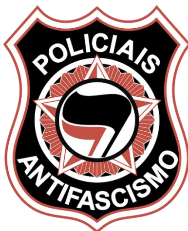
Figura 17 – Brasão do Movimento dos Policiais Antifascismo.

2) Policiais devem ser construídos como trabalhadores! O reconhecimento do direito de greve, de livre associação, de livre filiação partidária, bem como o fim das prisões administrativas, são marcos nesta luta contra a condição de subcidadania à qual muitos policiais estão submetidos. Acreditamos que este é o único caminho pelo qual policiais possam vir a se reconhecer na luta dos demais trabalhadores, sendo então reconhecidos por toda classe trabalhadora como irmãos na luta antifascismo (POLICIAIS ANTIFASCISMO, 2017).