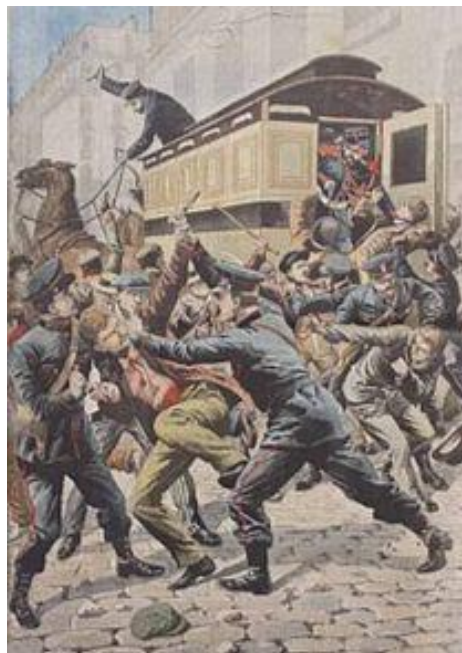
Figura 6 – Pintura retrata polícia contendo ataque a comboio de cargas.

Nesse caso, observa-se o nascimento de organizações fiscais em consonância com forças militares e policiais, numa intensa simbiose do econômico com o militar/policial. Essa situação se mantém, ainda que com funções diferentes, mas que a meu ver, não se separam, uma vez que órgãos fiscais têm determinado poder de polícia e que muitas intervenções militares serão efetivadas por conta de questões econômicas (BORDIN, 2020, p. 103).