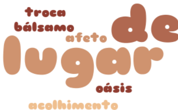
Figura 24 – Nuvem de palavras.

Como o Movimento de Policiais Antifascismo é visto pelos membros?