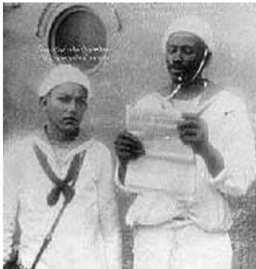
Figura 8 – João Cândido: o “Almirante Negro” lê as reivindicações dos marinheiros amotinados.

A República não investiu na invenção de nenhuma roda, apenas renomeou, e remodelou aos moldes dos novos arranjos sociais. Além das prometidas reformas arquitetônicas, que trariam modernidade europeia, também aos moldes do velho mundo, foram adotados os discursos cientificista da criminologia etiológica, inspirada em Lombroso e Bertillon, que aquele tempo era sucesso por lá (BRETAS, 1997; SANTOS, 2009).