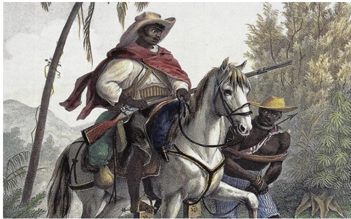
Figura 7 – Capitão-do-mato conduzido negro escravizado.

capacitados poderiam alcançar o oficialato sendo que concedidos os direitos e privilégios correspondentes, também exerceriam papel eficaz no governo colonial” (MOTA, 2018, p. 21).